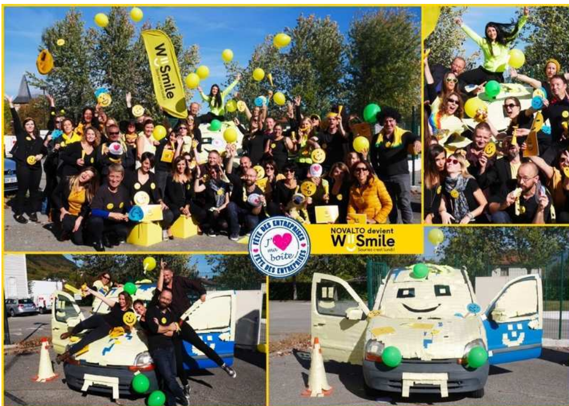
La photo gagnante Prix du Jury 2017

Déposez votre photo sur le site internet : www.jaimemaboite.com